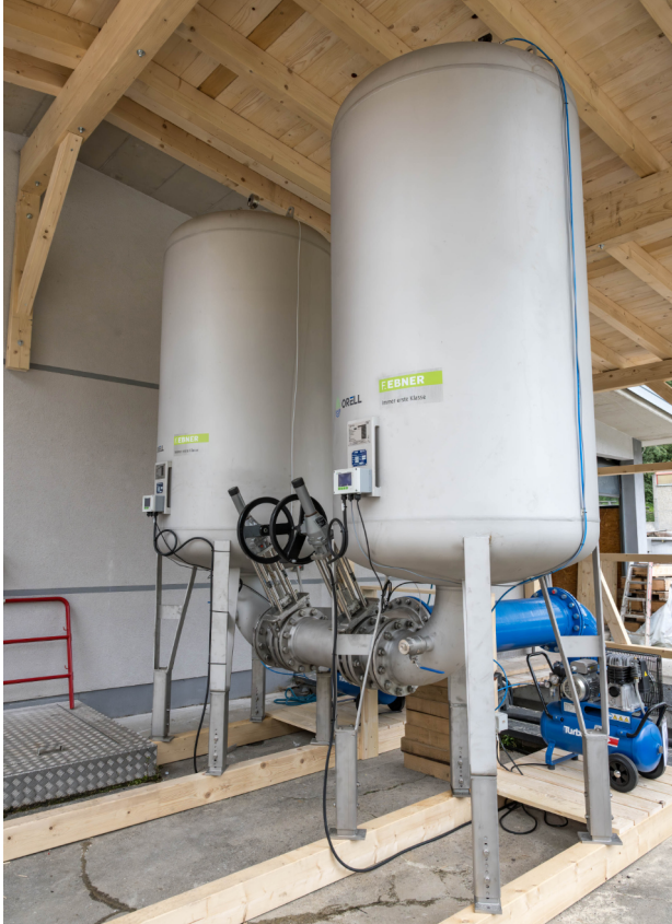
ORELL Druckschlagdämpfer 3000 Liter