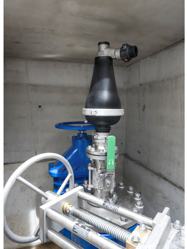
AIRVALVE Be- und Entlüftungsventil D-26/2

Das Projekt zeigt, wie frühzeitige Planung und gezielte technische Maßnahmen die Betriebssicherheit und Lebensdauer moderner Abwasseranlagen nachhaltig verbessern.